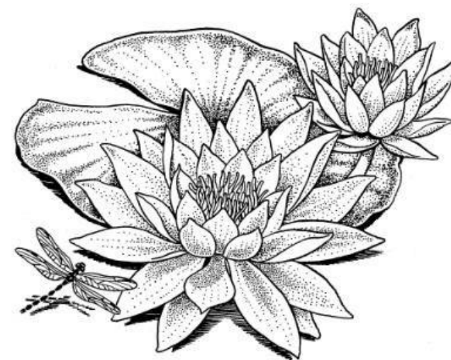
Fehér tündérrózsa ( Nymphaea alba )