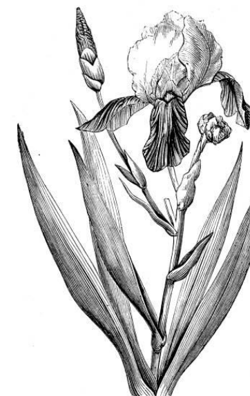
Kerti nőszirm (Iris x germanica)