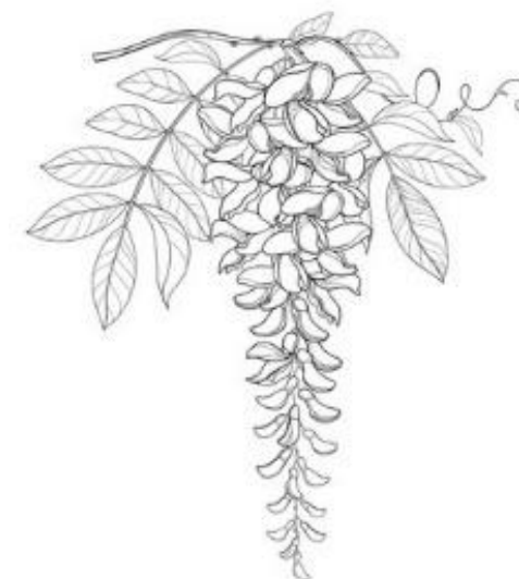
Kínai lilaakác ( Wisteria sinensis )