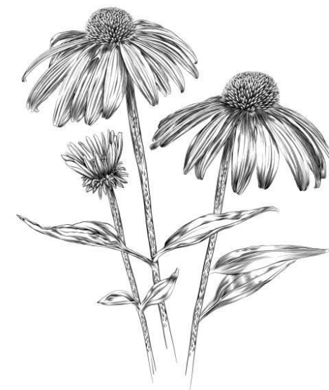
Bíbor kasvirág ( Echinacea purpurea )