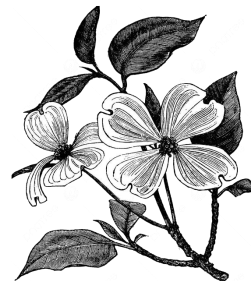
Amerikai virágsom ( Cornus florida )

Fél órával a Kert nyitása után nyitnak és a Kert zárása előtt fél órával zárnak. Hétfőnként az üvegházak ZÁRVA tartanak.