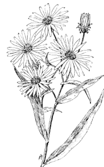
Kopasz őszirozsa ( Aster novi-belgii )