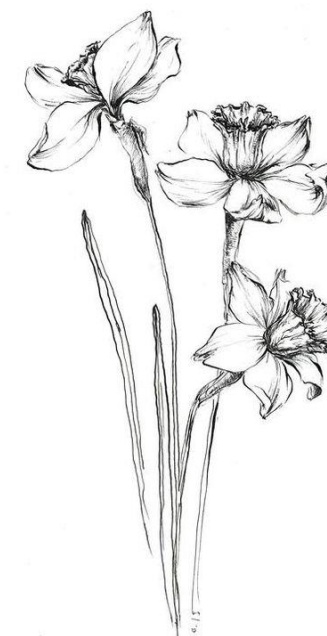
Nárcisz ( Narcissus sp. )