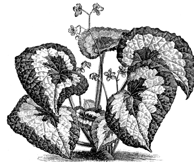
Királybegónia ( Begonia rex )

Ökológiai Kutatóközpont Ökológiai és Botanikai Intézet 2163 Vácrátót, Alkotmány út 2-4. Telefon.: 28-360-122 E-mail: botanikuskert@okologia.mta.hu www.botanikuskert.hu www.okologia.mta.hu